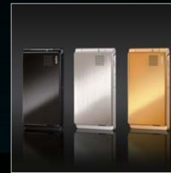
携帯電話機 au W55T 大阪デザインセンターグッドデザイン賞