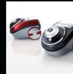
サイクロンクリーナー VC-1000X 大阪デザインセンターグッドデザイン賞