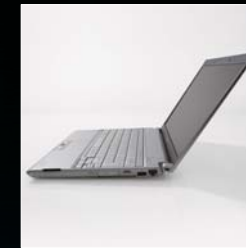
ノートパソコン Portege R500 レッドドットデザイン賞