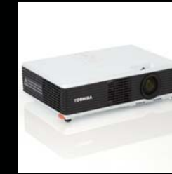
液晶データプロジェクタ TLP-X200/X100 グッドデザイン賞