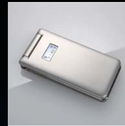
携帯電話機 SoftBank 814T レッドドットデザイン賞