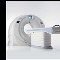
全身用X線CT診断装置 アクイリオン ワン グッドデザイン賞