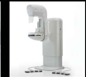
乳房X線撮影装置 MAMMOREX Peruru MGU-1000A レッドドットデザイン賞