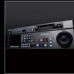
フラッシュメモリーレコーダ GFSTATION グッドデザイン賞