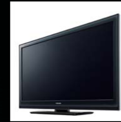
液晶テレビ REGZA 52/46ZH500 グッドデザイン賞