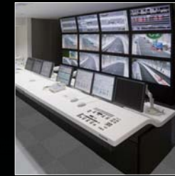
首都高速道路中央環状新宿線 (山手トンネル)交通管制システム グッドデザイン賞