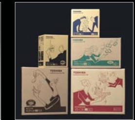
家電製品/パッケージ 日本パッケージデザイン大賞入選 ジャパンパッケージデザインコンペティション入賞