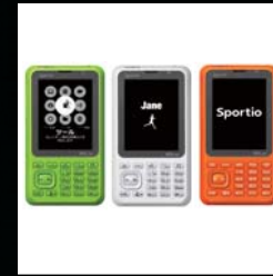
携帯電話機 au Sportio グッドデザイン賞 大阪デザインセンターグッドデザイン賞 GUIを中心としたコミュニケーションデザイン グッドデザイン賞