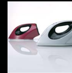
スチームアイロン TA-GX100 レッドドットデザイン賞