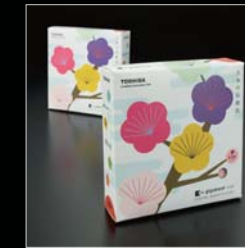
gigabeat U103 iFデザイン賞 日本パッケージデザイン大賞入選 ジャパンパッケージデザインコンペティション入賞