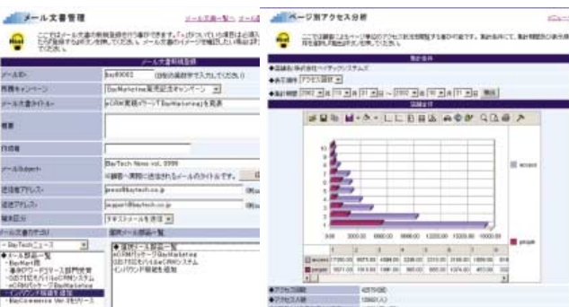
BayMarketing™画面例 Examples of BayMarketing™ screens