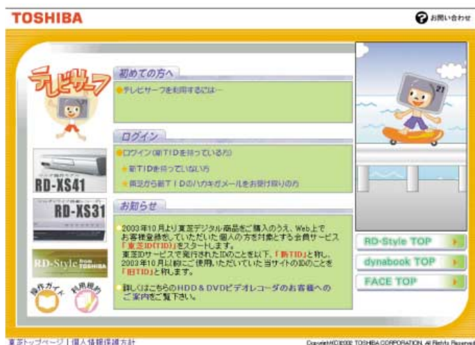
テレビサーフ™ 画面イメージ TV-Surf screen shot

HDD & DVDレコーダー“RD-Style™”の機器連動型ウェブサービスとして、製品部門と連動したテレビ番組表提供サービス“テレビサーフ™”を開発し、提供を行っている。