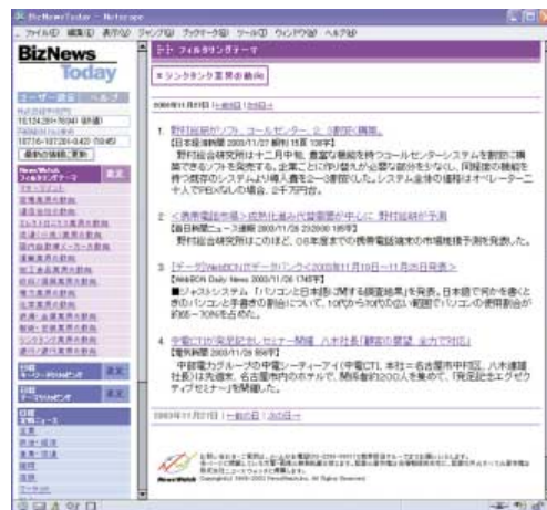
BizNewsToday™画面イメージ BizNews Today™ screen shot

“BizNewsToday™”は (株)日経デスクトップの商品である“ニュース&クリッピング”と(株)ニュースウォッチのフィルタリング技術を融合し, より即日性と速報性を重視したナレッジエリート向けの情報配信サービスである。ビジネスユーザーのニーズが高い日経四紙 (当日) を含む一般紙から業界紙までの幅広いニュースソースの掲載記事の中から, 自然言語処理技術により, それぞれの記事をテーマに沿って分析し順位付けを行い, 利用者の関心に応じた最新記事が自動的にピックアップされることができ, より効率的に最新ビジネス情報のチェックができる。企業内ユーザーであれば1名単位で購入できるのも大きなメリットとなっている。