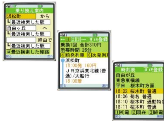
“サクッと乗換DX™”の画面例 Examples of Sakutto-Norikae DX screens

サクッと乗換DX™は待ち受け動作に対応しており, 待ち受け状態からすぐにアプリケーションに切り替えて各機能を利用できる。駅履歴, 経路履歴による操作性の向上と経路駅指定, 前後列車指定など検索機能の強化が行われており, 便利な機能として運行情報の自動チェックも可能である。更に通信データが最小限に抑えられており, 通信費の削減に貢献する。今後は更なる利便性の向上を図りながら, 他キャリアへの展開を進める。