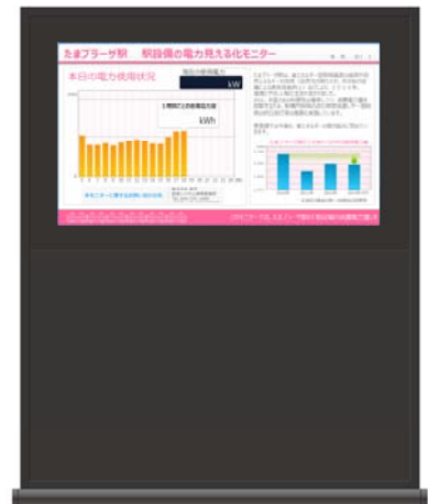
設置するモニター (イメージ)