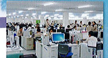
要素開発・プロセス開発