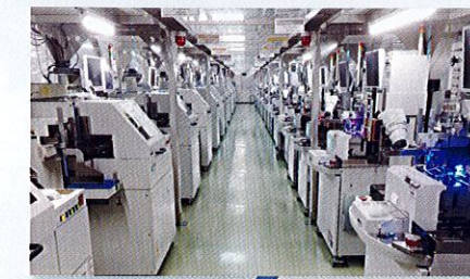
組立製造・評価ライン