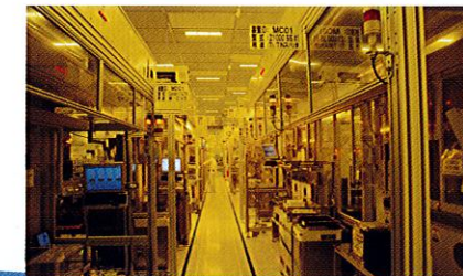
チップ製造 (5・6・8 インチ)